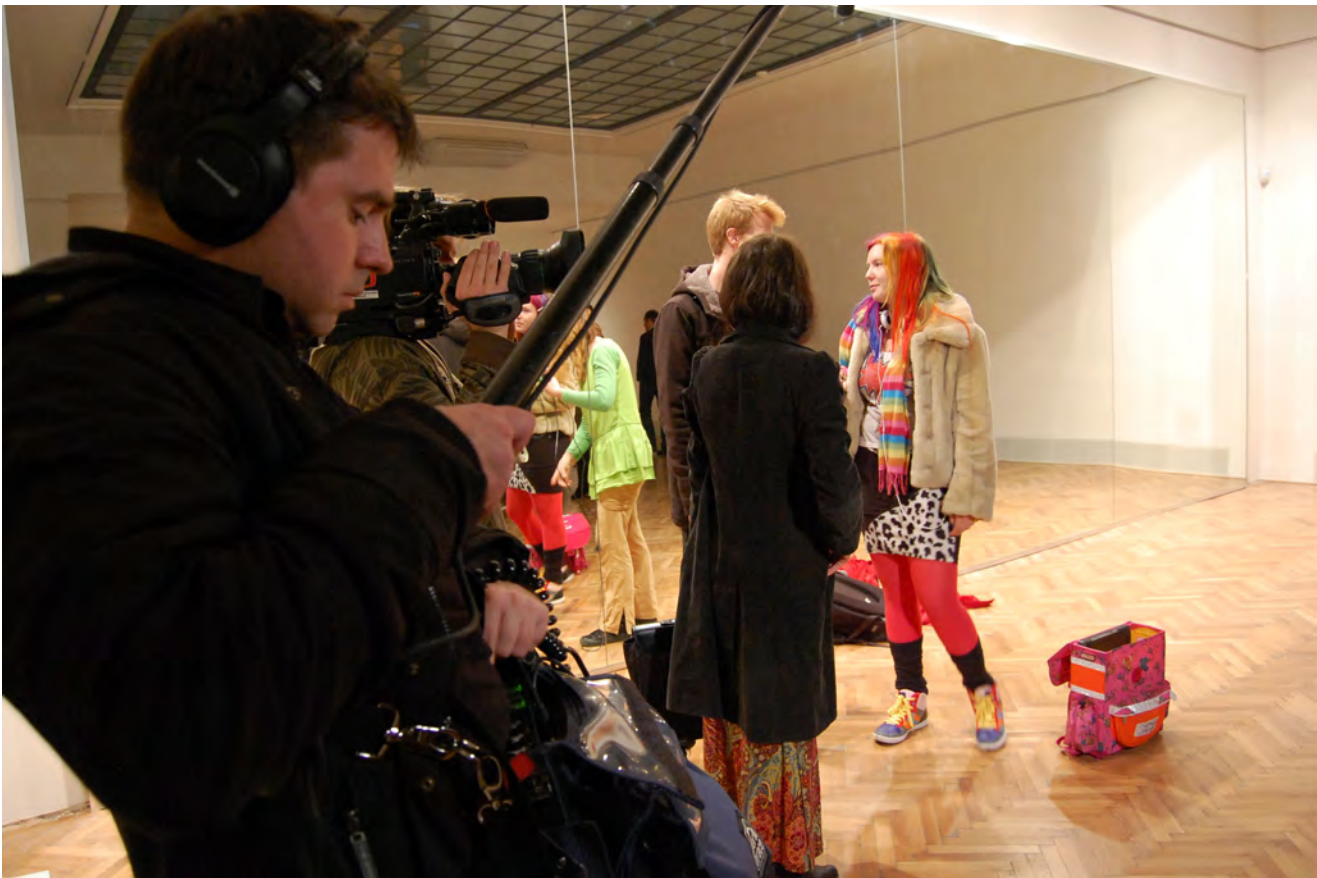
Obr. č. 11 – 13, Velvet Background, Dům umění, Brno, 17. 11. 2009