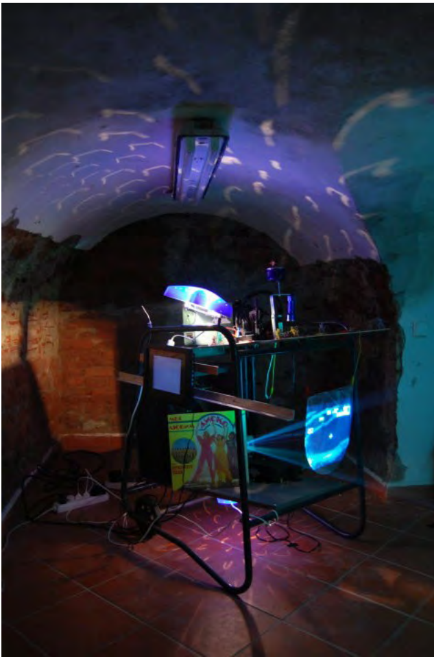
Obr. č. 9 – 10 z Prima materia TERCIVS

MATERIA MALTA hop, nahoře instalace Filina Kruga, dole koncert L'ubozvučné Konvalinky