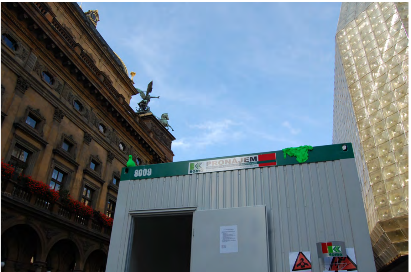
Obr. č. 7 – 8 Kontejnery umění v Praze, na obr.č. 8 na kontejneru objekt Petra Bulavy (holub a jeho hovno)