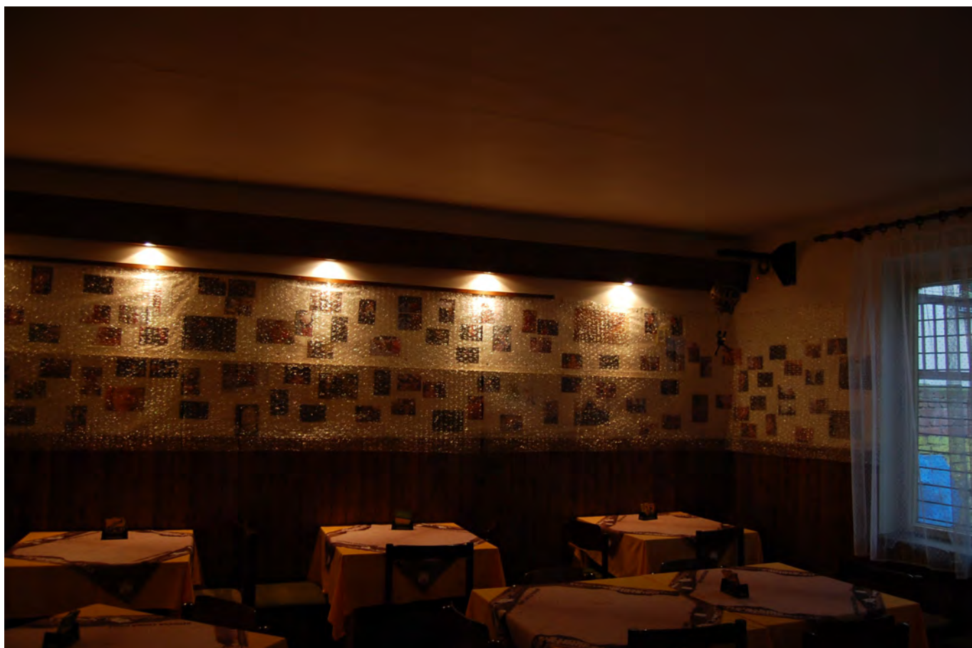
Obr. č. 2-4 prostory Klubu Leitnerova, moje výstava Just já