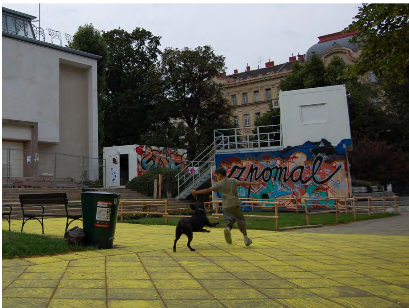
Obr. č. 5 – 6 Kontejnery umění před Domem umění v Brně