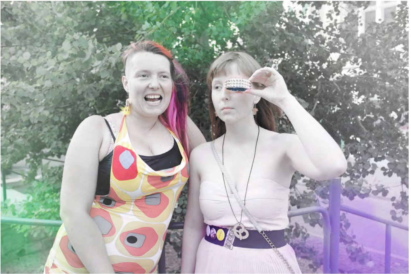
Obr. č. 14 – fotografie z vernisáže Filina Kruga Uchil uchilu